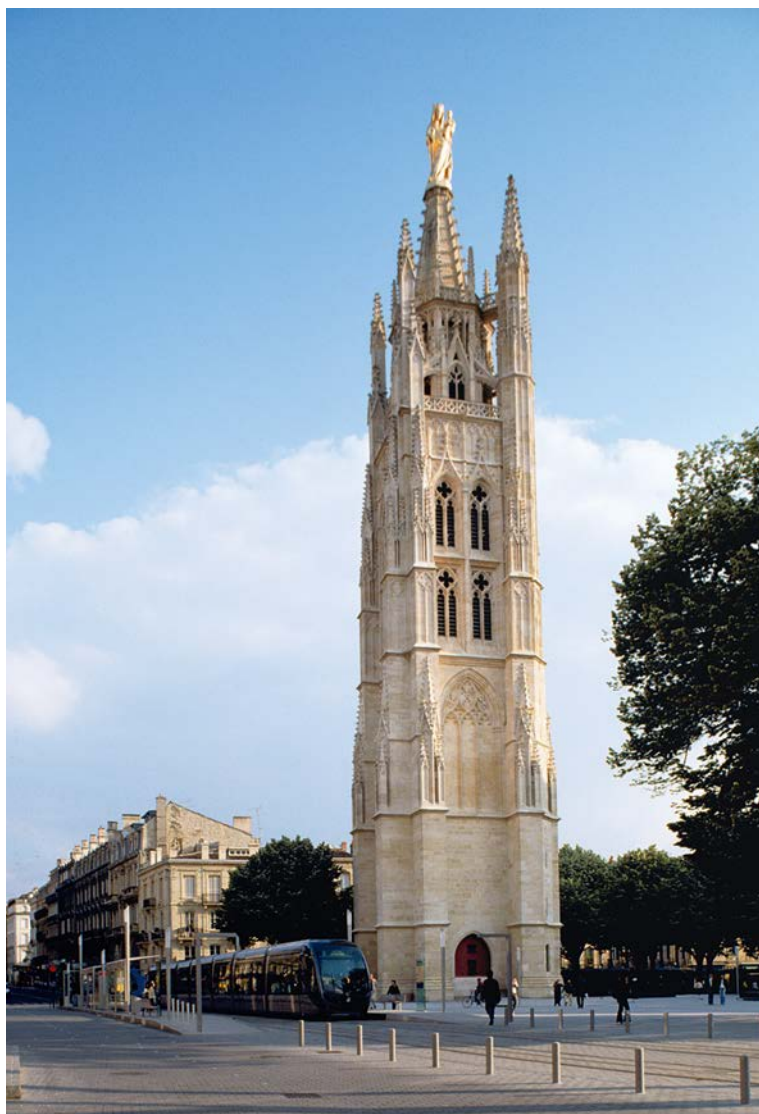
Table de lecture du paysage urbain