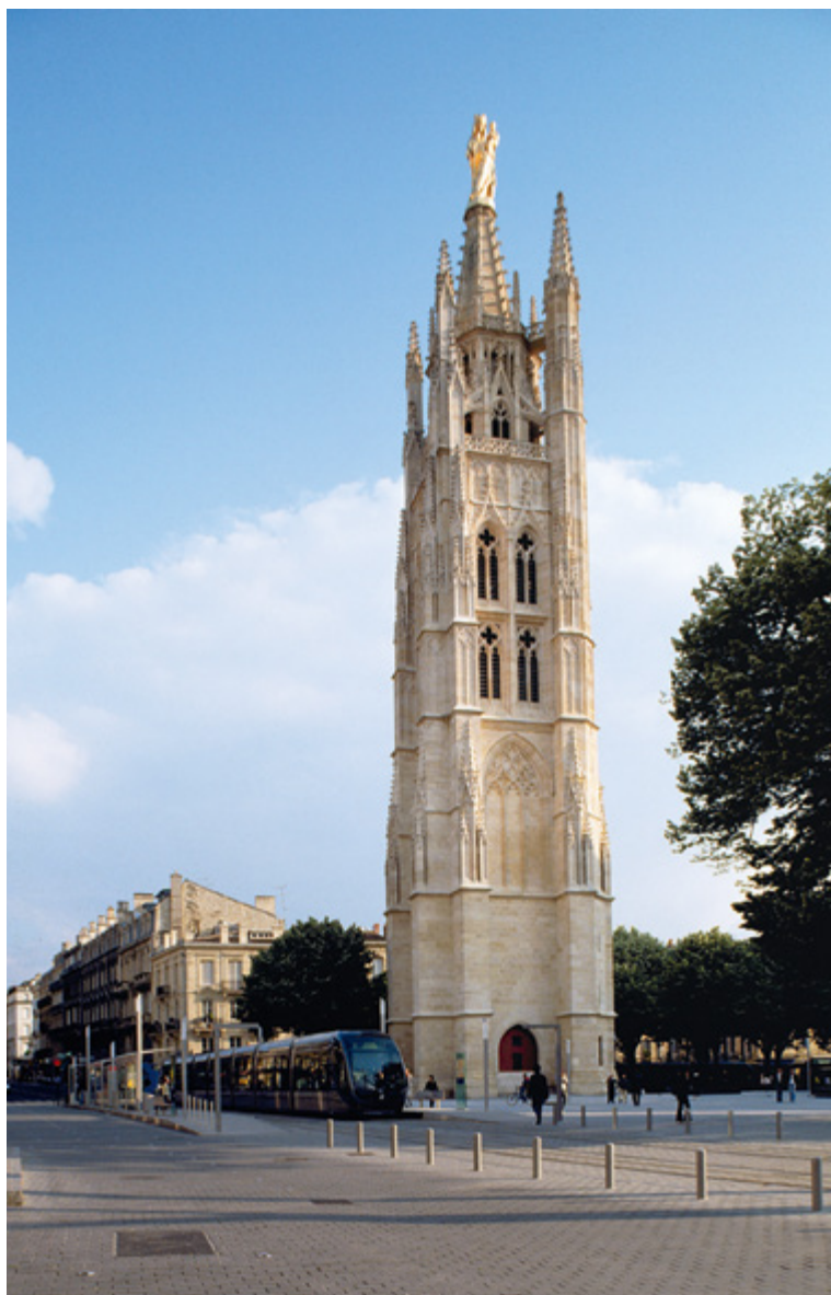
Table de lecture du paysage urbain